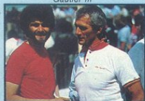
Fountaine Charente Maritime