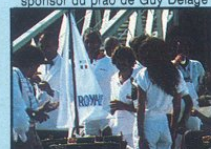
Le cocktail royal de Royale avant le départ