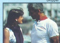
La plus jolie hôtesse du port de La Rochelle