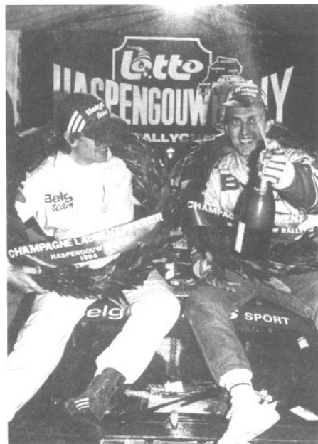
Droogmans-Joosten : trois podiums avec la Porsche.