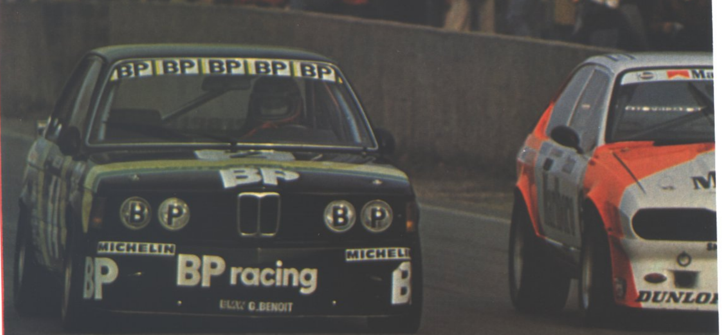
Cudini (BMW 323) et Snobeck (Alfetta) sur la même ligne : « Plus vite que moi, tu meurs ! ».