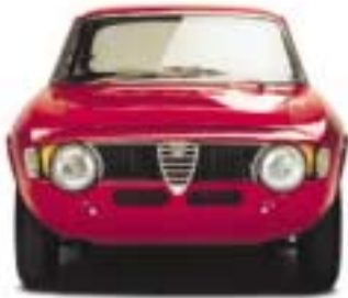
Giulia Sprint GTA 1965 - 1969