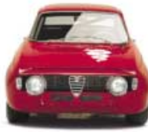
GTA 1300 Junior 1968 - 1973