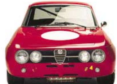
1750 GT Am 1970 - 2000 GT Am 1971